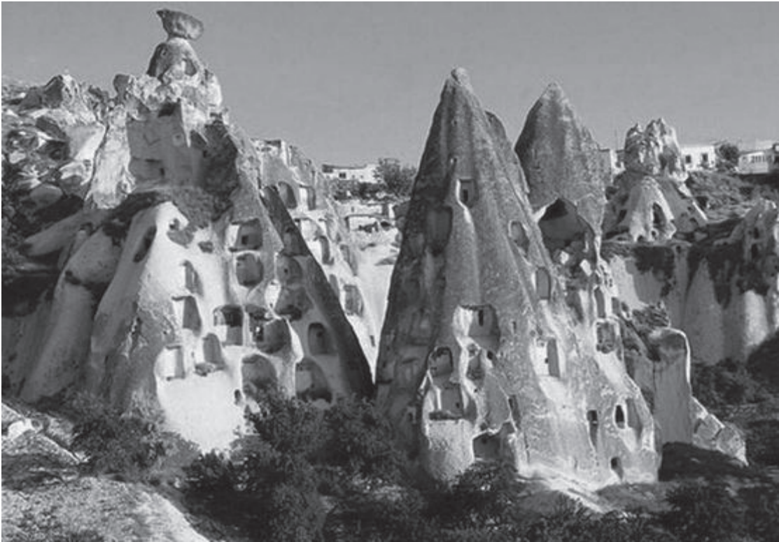
Nevşehir-Kapadokya (yılda yaklaşık 3 milyon kişi ziyaret ediyor):

Ülkemizde çok sayıda jeolojik miras ögesi bulunmasına rağmen, bunların çoğunluğunun tescil edilmediği/edilemediği bilinmektedir. Bunlar arasında Manisa Kula volkanitleri ülkemizde tescil edilerek Avrupa Jeolojik Miras listesine dahil edilen ender yerlerden biridir. Henüz arzu edilen çalışmalar yürütülemesede, Nevşehir Kapadokya, Denizli Pamukkale, Bitlis Nemrut Dağı ve Van Gölü, Konya Karapınar Maar ve Obrukları, Erzurum Narman bölgesi hızlıca akla gelen önemli jeolojik miras öğeleri olarak sıralanabilir.