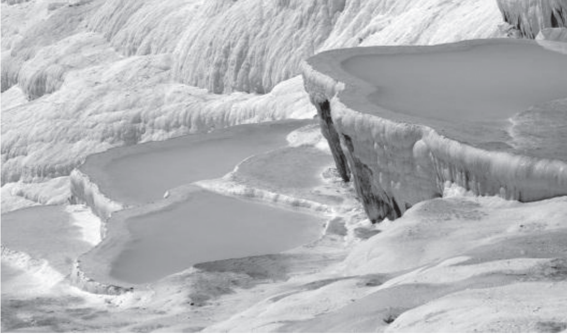
Pamukkale Travertenleri (yılda yaklaşık 1 milyon kişi ziyaret ediyor)