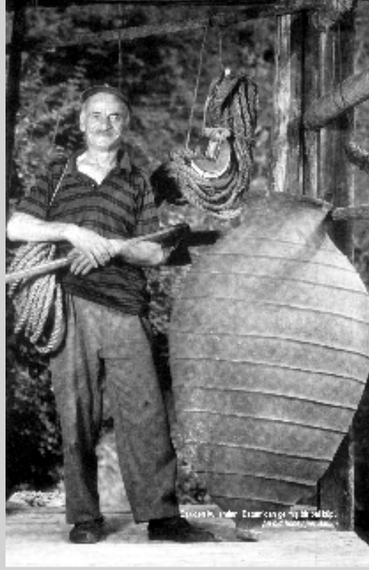
Çelebi, under Çelebiçayğı M. 1963 Çelebi, under Çelebiçayğı M. 1963