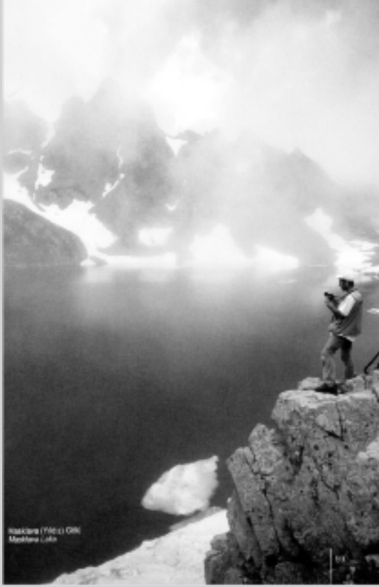
Maçka Gölü (1962) OSM Maçka Lake