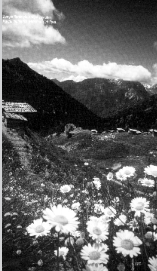
Çelebi Çelebiçayğı M. 1963 Çelebi Çelebiçayğı M. 1963