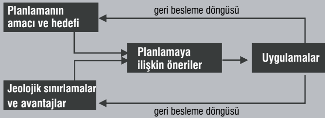
Şekil 1. Planlama Süreci Akış Şeması.

Planlama süreci akış şeması aşağıda Şekil 1 'de gösterilmiştir.