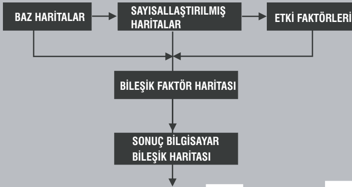
Şekil 2. Bileşik Haritaların Hazırlanış Süreci.

faktörü uygulanarak 'Etki Faktörleri Haritaları' oluşturulur (Şekil 3 C).