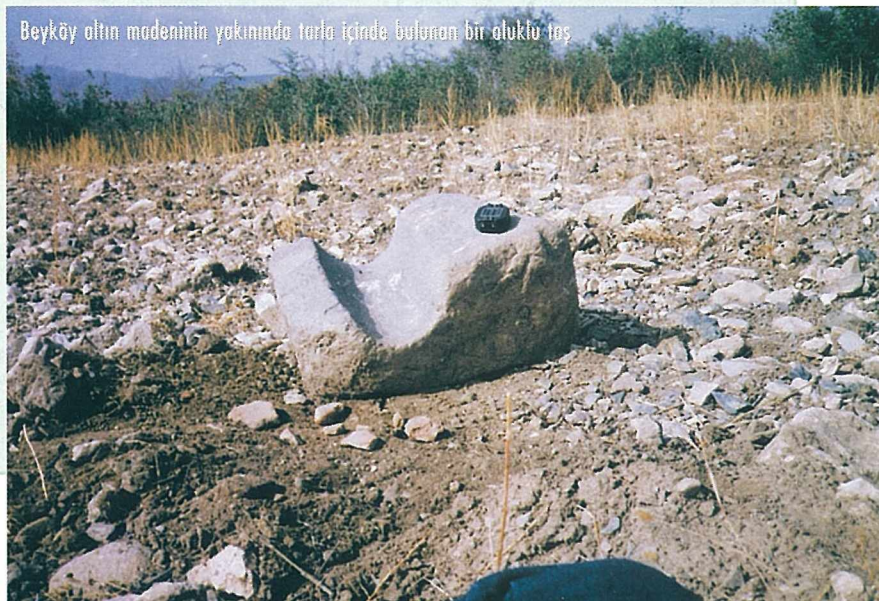
Beyköy altın madeninin yakınında tarla içinde bulunan bir oluklu taş

Eski çağ altın madenlerinde bulunan oluklu taşların elde edilme şekli şöyledir: Madenden çıkartılan cevherli iri parçalar kıрма-ezme ve öğütme işlemleriyle kum boyutuna kadar küçültülür. Kayaç içindeki altın taneleri bu işlemler sırasında serbest hale gelir. Altın tanelerini diğer kaya tanelerinden ayırmak üzere bu malzeme oluk sistemine yavaş yavaş akıtılırken sisteme su eklenir. Özgül ağırlığı 19 g/cm 3 olan altın kanalın içinde hemen dibeye çökerek birikir, buna karşın özgül ağırlığı 2-3 g/cm 3 arasında değişen kuvars, feldispat, kalsit, serisit gibi mineraller suyla