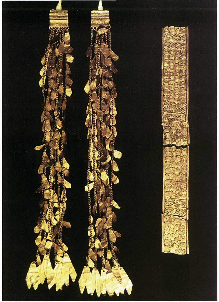
Schliemann'ın Troya'da bulduğu altın küpe ve bilezik. İstanbul Arkeoloji Müzesi'nde sergilenmektedir.

Troya savaşı gerçekte, Akhalar önderliğindeki Yunanistan'ın istilacı kavimleriyle Troya'lılar, Le-