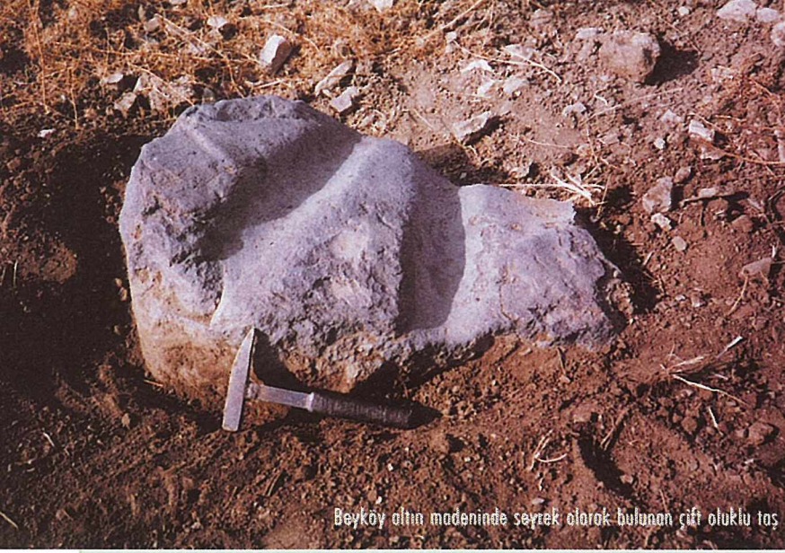
Beyköy altın madeninde seyrek olarak bulunan çift oluklu taş

beraber hızla akarak ortamdaki uzaklaşır. Oluk (akıtma kanalı) içerisinde veya biriktirme havuzunda % 1 oranında altın içeren konsantr elde edilir. Sulu yıkama işleminde farklı özgül ağırlıktaki tanelerin farklı davranış sergilemeleri yakın zamana kadar Anadolu köylerinde buğdayın taş ve samandan ayrılması için kullanılmaktaydı. Bu işleme Anadolu'da "çalgan" adı verilir.