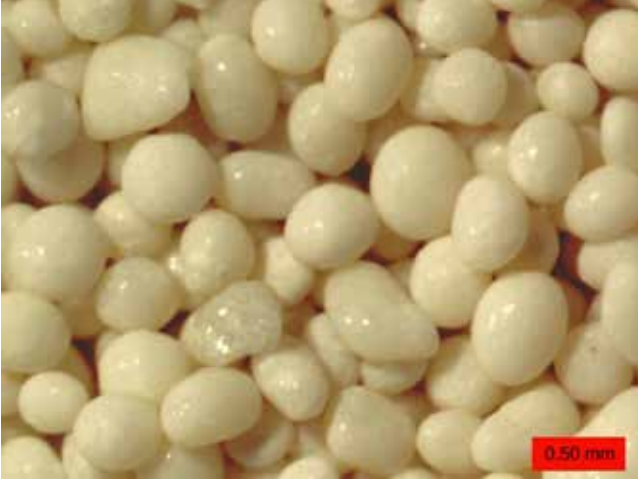
Şekil 1: Joulter's Cay (Bahamalar) sahili ooidleri ( https://commons.wikimedia.org/wiki/User:Wilson44691#/media/File:JoultersCayOoids.jpg )

anlamak için, iyi bir jeoloji eğitiminden geçmeye gerek yoktur. Ancak ister ooid, ister oolit formunda olsun, çökel ortamının yorumlanmasında oldukça yararlı ipuçları sunduğundan dolayı çalışmalarında bunları tespit eden yerbilimciler için oldukça değerlidir.