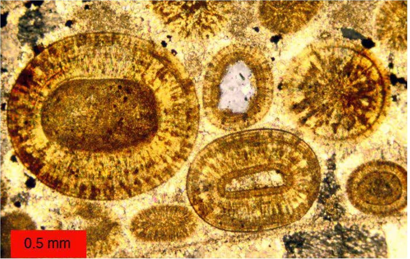
Şekil 3: Oolitik kireçtaşı incekesit görünümü (Carmel Formasyonu, Orta Jura, Güney Utah). Ooidlerin çekirdeğinde fosil parçası ve kuvars bulunmakta. Işınsal kalsit mineralleri çekirdeğin etrafını başlangıçta çekirdeğin şekline uygun sonrasında yuvarlaklaşarak sarmaktadırlar. ( https://commons.wikimedia.org/wiki/User:Wilson44691#/media/File:CarmelOoids.jpg )

karbonatlı kayalarda saptanan hidrokarbon rezervlerinin yarısından fazlasına ev sahipliği yapmaktadır (1). Prekambriyen döneminden (en az 542 Milyon yıl öncesi) günümüze kadar ooid ve oolit oluşumları dünyanın çeşitli bölgelerinde gözlenebilmektedir (1).