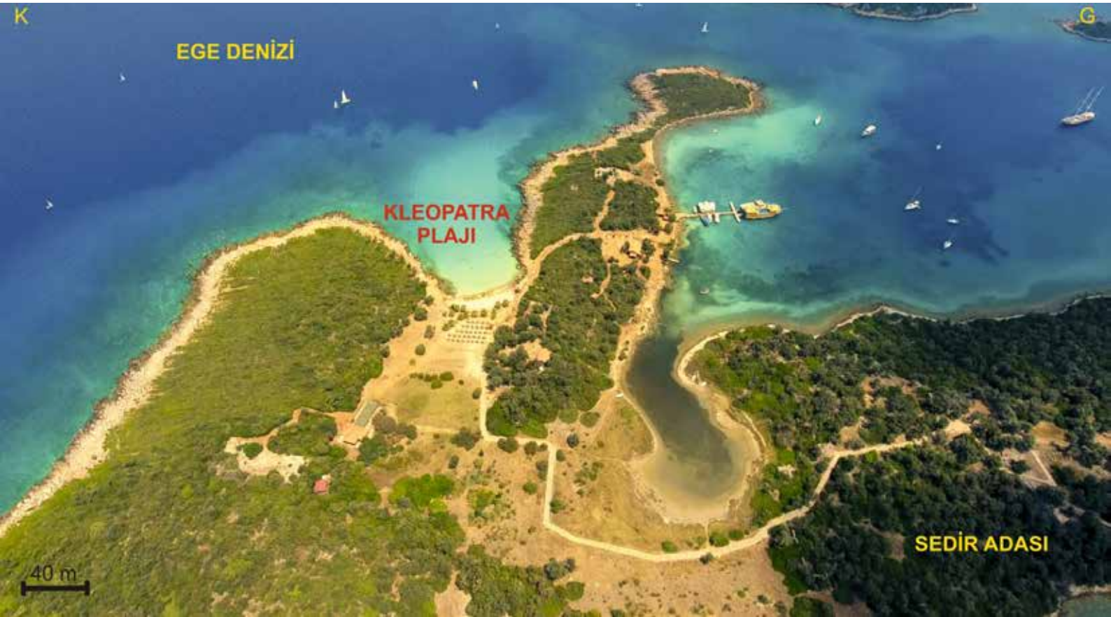
Şekil 5: Sedir Adası ve Kleopatra Plajına teknelerle ulaşım sağlanmaktadır. (Fotoğraf Sayın Gökay Akkaya’nın izniyle kullanılmıştır).

Kleopatra Plajının 0,3-0,8 mm aralıkta tane boy- lu, küremsi-elipsoidal ooidlerden oluştuğu, çe-