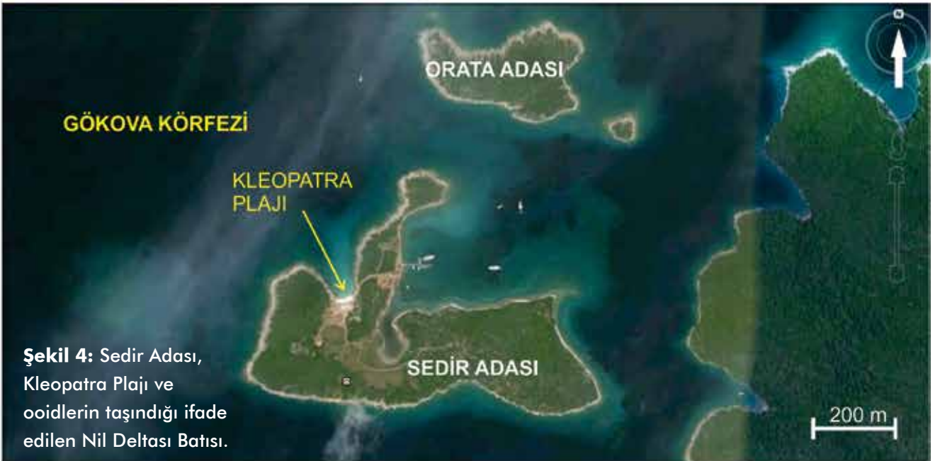
Şekil 4: Sedir Adası, Kleopatra Plajı ve ooidlerin taşındığı ifade edilen Nil Deltası Batısı.