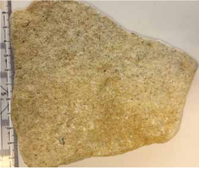
Şekil 9: Kleopatra Plajı oolitlerinin yakından görünümü.

nisküs şeklindeki kalsit çimento ile bağlandığını belirtmiştir. Yapılan detaylı elektron mikroskobu çalışmaları sonrası ortamdaki alg ve bakteri aktivitesinin ooid çökelimine izin veren karbonatın ana kaynağı olduğunu belirtmişlerdir (10).